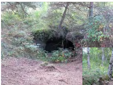
Entrée de galerie bouchée par terrassement en septembre 2013 et exemple de la pose d'une grille sur une entrée de cavité à Bas-en-Basset par le CEN Auvergne. Des travaux similaires seront menés en 2014 à Coucouron.

Le contrat Natura 2000 est financé entièrement par des fonds européens et du Ministère de l'écologie. Les premiers travaux ont été réalisés par une entreprise locale (TPV Daniel Rolle – Solignac-sur-Loire), et par l'équipe technique du CEN Auvergne. Sa mise en œuvre a été possible grâce au concours de la mairie de Solignac, qui a accepté de déléguer la gestion du site au CEN Auvergne par convention sur une période de 10 ans.