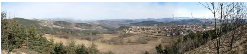
Vue sur Solignac-sur-Loire