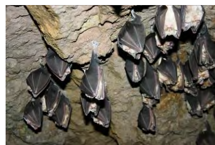
Grands Rhinolophe