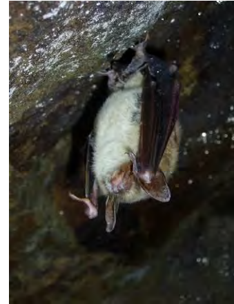
Le Grand Murin fréquente également la carrière en hibernation