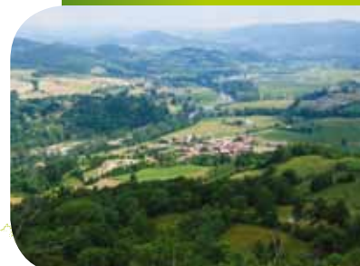
Vue des Gorges à St-Vincent

Cathy ESPERET, Service Environnement du Conseil Général de la Haute-Loire 1 place Monseigneur de Galard • CS20310 • 43009 LE PUY-EN-VELAY Cedex Tél. : 04. 71. 07. 43. 86 • Fax : 04. 71. 07. 43. 52 • E-mail : catherine.esperet@cg43.fr Site internet : www.cg43.fr