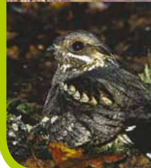
Engoulevent d'Europe