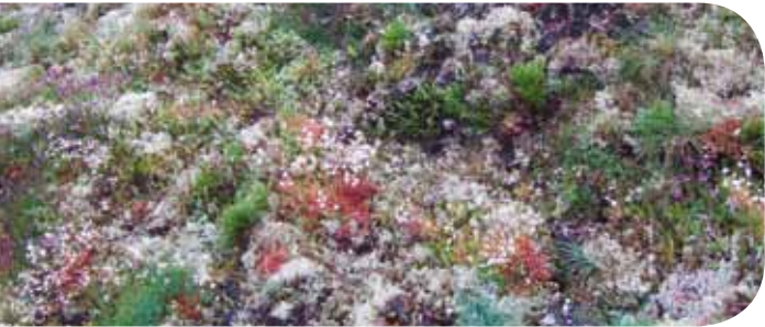
Pelouse pionnière vivace

18 habitats naturels d'intérêt communautaire ont été répertoriés dont :