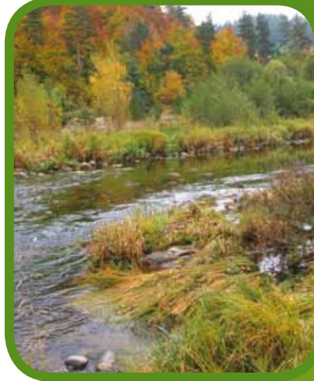
Gorges de la Loire à Arlempdes

Ces deux derniers sites font actuellement l'objet d'un recalage du périmètre à l'échelle cadastrale et devraient fusionner pour n'en former plus qu'un.