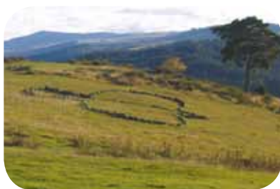
"L'oiseau de pierre", site de Bonnefond