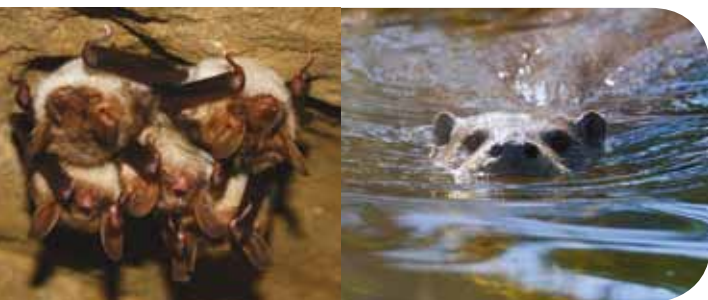
Grand Murin