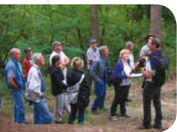
Formation propriétaires forestiers © Conseil Général 43