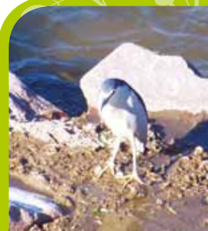
Bihoreau gris

Deux nouvelles espèces nicheuses, l'Aigle botté et l'Aigrette garzette, sont venues compléter la liste établie en 2004.