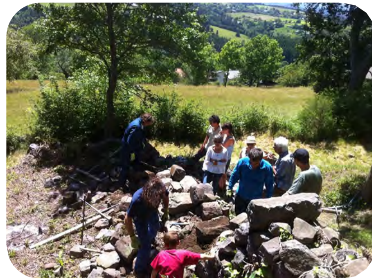
Un exemple de chantier d'insertion à Saint-Julien-de-Chapteuil (Haute-Loire).