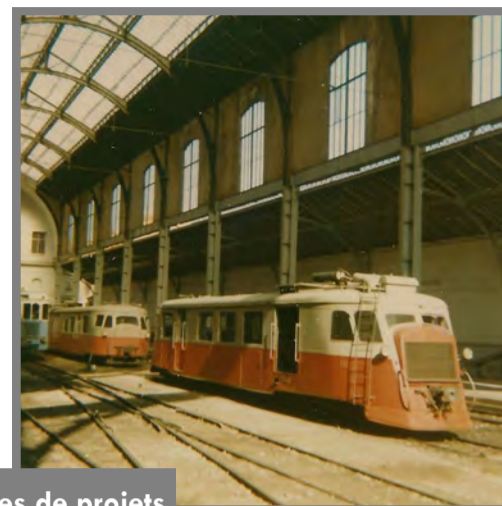
Exemples de projets soutenus