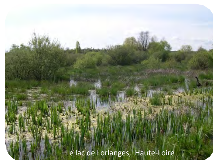
Le lac de Lorlanges, Haute-Loire

Tél : 04 73 30 90 01 ou sur www.auvergne.fondation-patrimoine.org