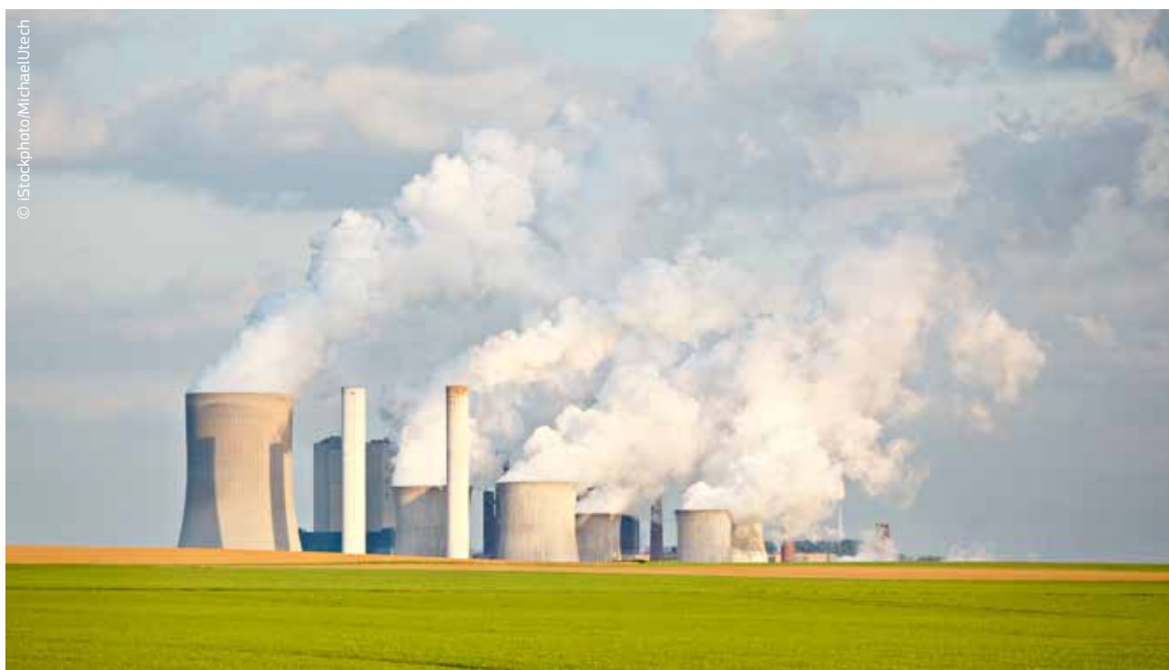
Le système d'échange de quotas d'émission permet de réduire les gaz à effet de serre à moindre coût.

Ces discussions se déroulent au niveau politique le plus élevé. Lors du sommet des dirigeants mondiaux sur le changement climatique organisé en septembre 2014 à l'initiative de Ban Ki-moon, secrétaire général des Nations unies, quelque 120 responsables politiques ont exprimé leur volonté de contribuer aux efforts mondiaux qui doivent être déployés d'urgence. Les entreprises et la société civile ont participé en masse, et 500 000 personnes ont défilé dans les rues de New York lors de la «Marche pour le climat».