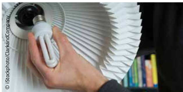
La simple geste d'utiliser des ampoules à faible consommation d'énergie peut faire beaucoup.

L'UE est le premier pourvoyeur d'aide internationale au développement et le principal bailleur de fonds consacrés à la lutte contre le changement climatique. Lors de la conférence de Doha sur le changement climatique, en 2012, l'UE et un certain nombre d'États membres ont annoncé des contributions volontaires au financement de la lutte contre le changement climatique dans les pays en développement,