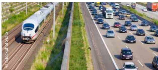
Le transport constitue l'une des principales sources d'émission de gaz à effet de serre.

La «feuille de route vers une économie compétitive à faible intensité de carbone à l'horizon 2050» et le livre blanc sur les transports publiés par la Commission indiquent que, d'ici à 2050, le secteur des transports devrait réduire ses émissions de CO 2 d'environ 60 % par rapport au niveau de 1990. D'ici à 2030, afin de soutenir les objectifs du cadre pour les politiques en matière