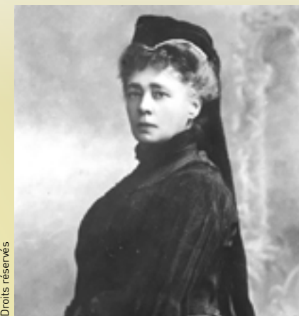
Bertha Von Suttner

Cette aristocrate britannique, épouse de Charles, prince de Galles, plus connue sous le nom de « Lady Dy » est une femme du peuple. Elle est l'une des femmes les plus célèbres au monde de la fin du XX e siècle, une des icônes féminines éminentes de sa génération, une icône de la mode. Cette figure emblématique mondiale de la charité crée de nombreuses associations pour défendre des causes telles que le sida. Son soutien permet de changer le regard que portent les gens sur cette maladie. Elle lutte aussi pour l'éradication des mines antipersonnel à travers des voyages médiatisés pour la Croix-Rouge et le Croissant-Rouge. Elle aide surtout les enfants pauvres d'Afrique et est aux côtés de nombreuses personnalités comme Nelson Mandela, Mère Teresa et le Dalaï-lama. Dix-sept ans après sa mort, elle reste pour tous, une figure emblématique.